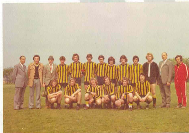
1e elftal 1973-1974