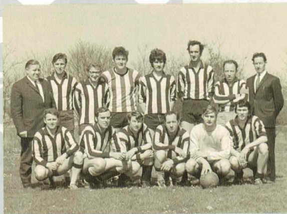
2e elftal 1971-1972