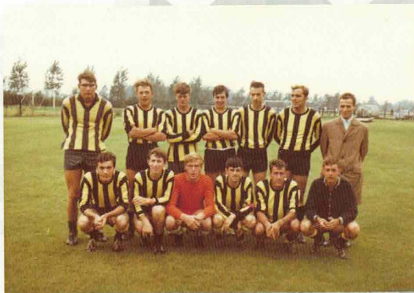
1e elftal 1969-1970

Ook diverse dames leverden hand en span diensten.