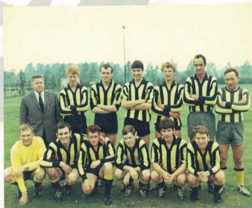
2e elftal 1969-1970