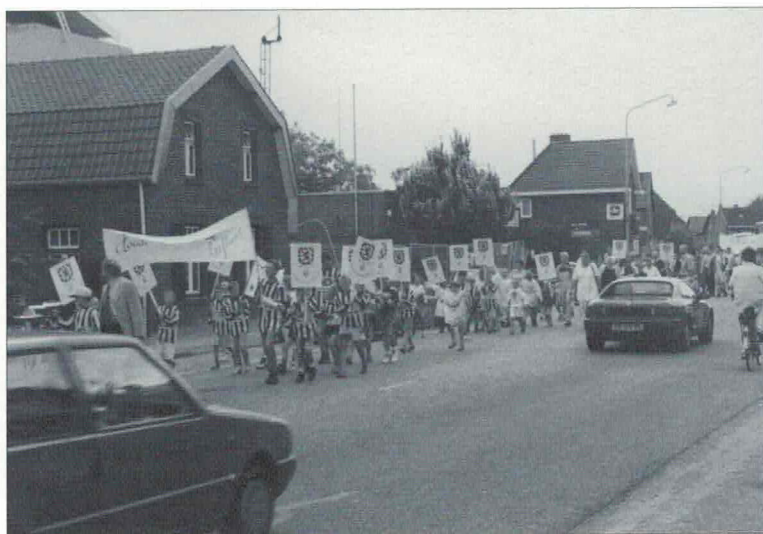
In optocht naar het gemeentehuis om de petitie aan te bieden aan de gemeenteraad van Maasbracht op 26 augustus 1996.