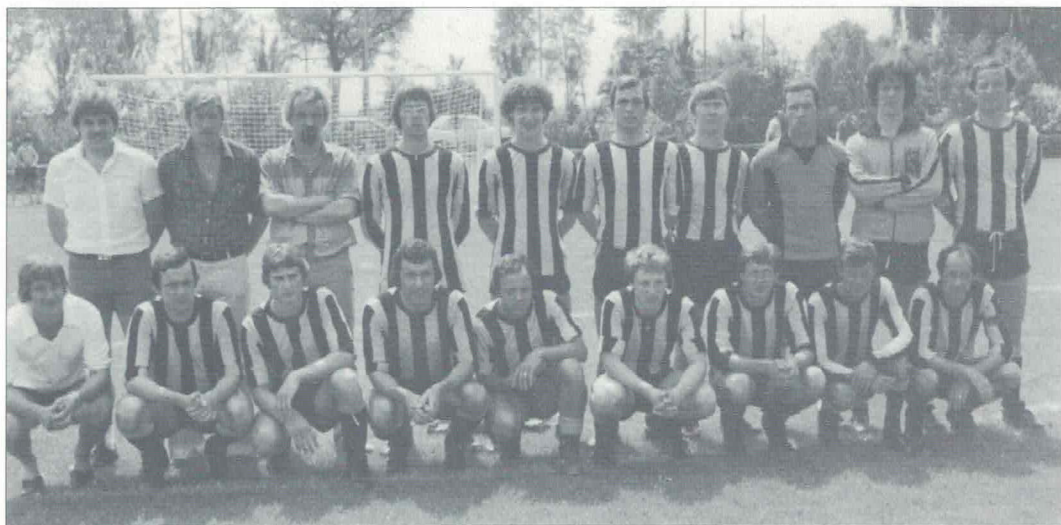
Kampioensteam seizoen 1978-1979.