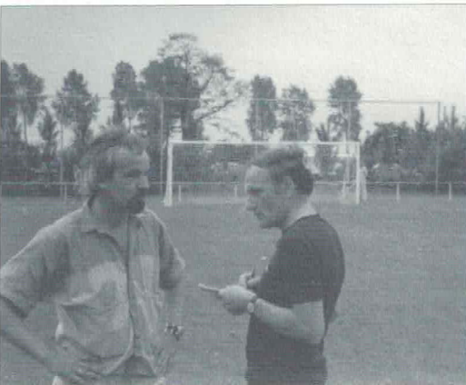
Ook de schrijvende pers is aanwezig.