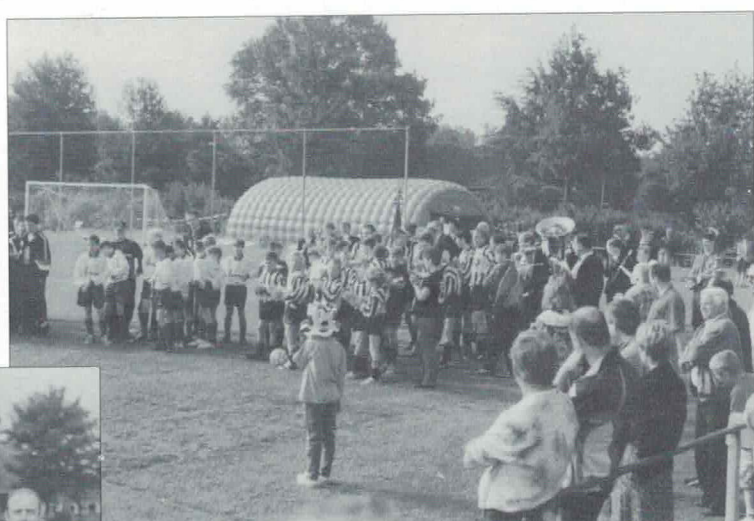
Opstelling van de teams.