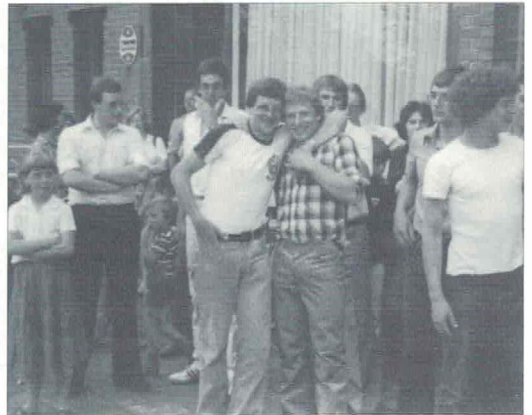
In afwachting van .....