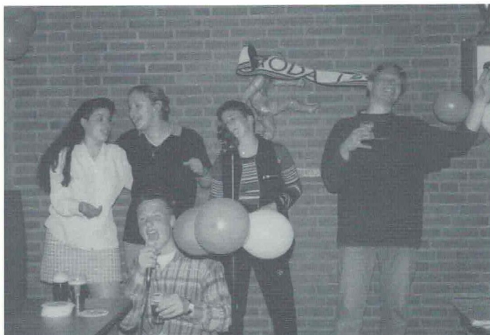
Voetballen is samenwerken in goede verstandhouding. Zingen doe je ook samen.