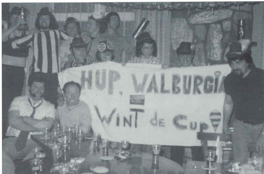
Feesten in clublokaal Mofers.