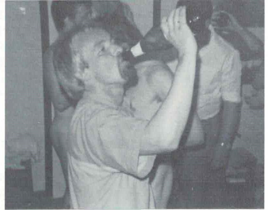
Van al die interviews krijgt men dorst.