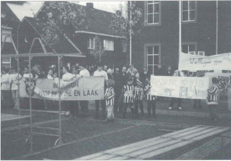
In optocht naar raadsvergadering op 27 maart 1997.