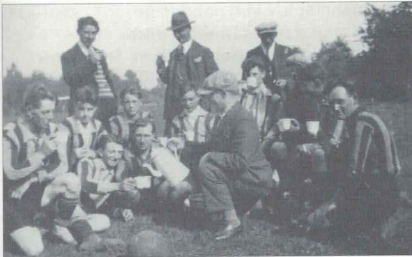
Elftalfoto uit 1930.