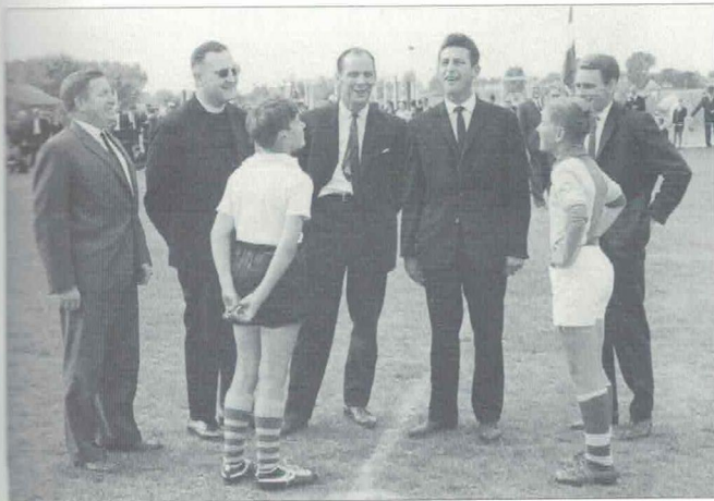
Tossen aanvoerders jeugdteams bij de openingswedstrijd Walburgia - Stevensweert.