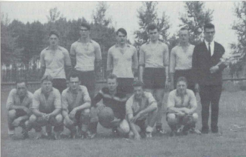
Openingswedstrijd sportpark Holtum op 13 augustus 1964.