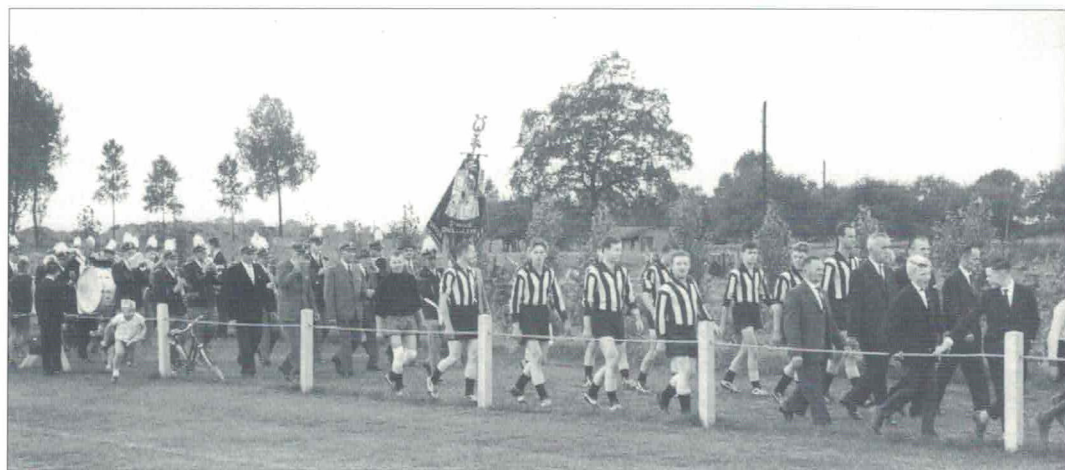
Onder begeleiding van de harmonieën op weg voor opening sportveld.