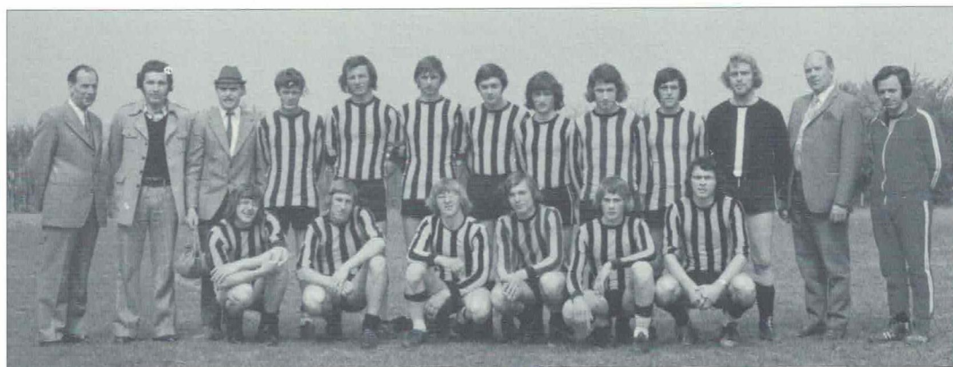
Walburgia seizoen 1973-1974.