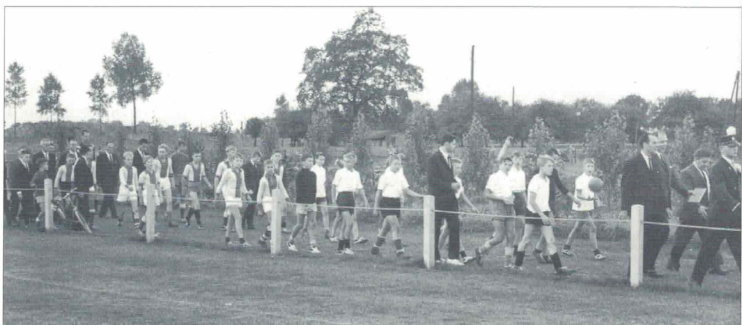
Jeugdteams Stevensweert en Walburgia.