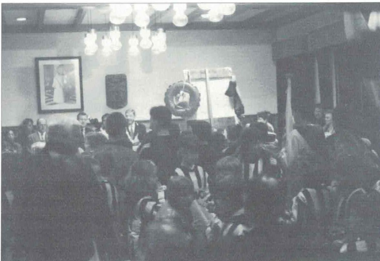
Het was erg druk in de raadzaal.