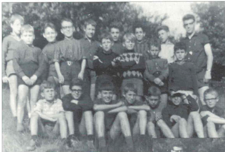
1 e kamp Roggel