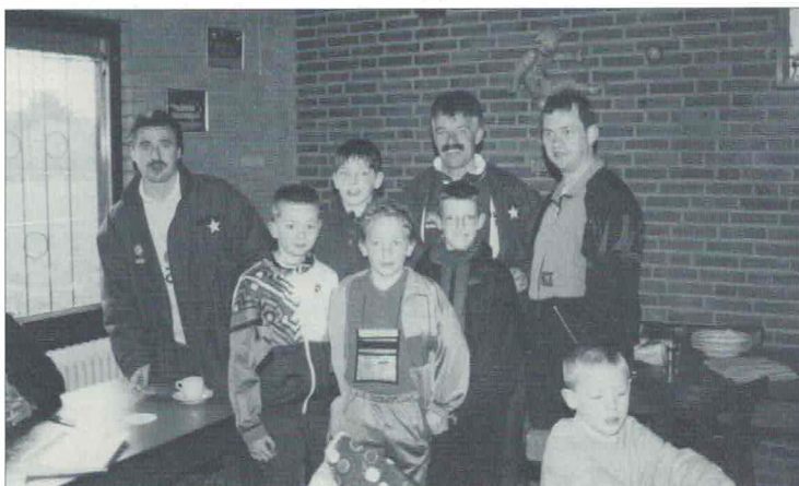
Trainersstaf MVV op bezoek.