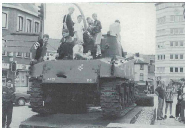
Wij hebben de beker.....veroverd!