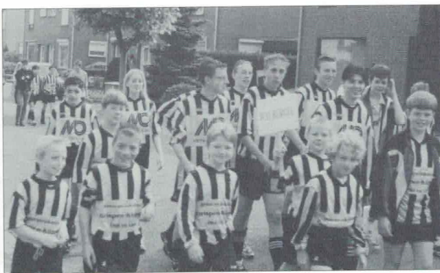
Internationaal toernooi, Pinksteren 1998. Defilé door het dorp.