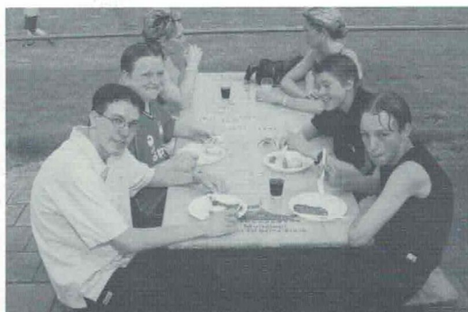
Als er goede koks zijn, zijn er altijd goede eters.